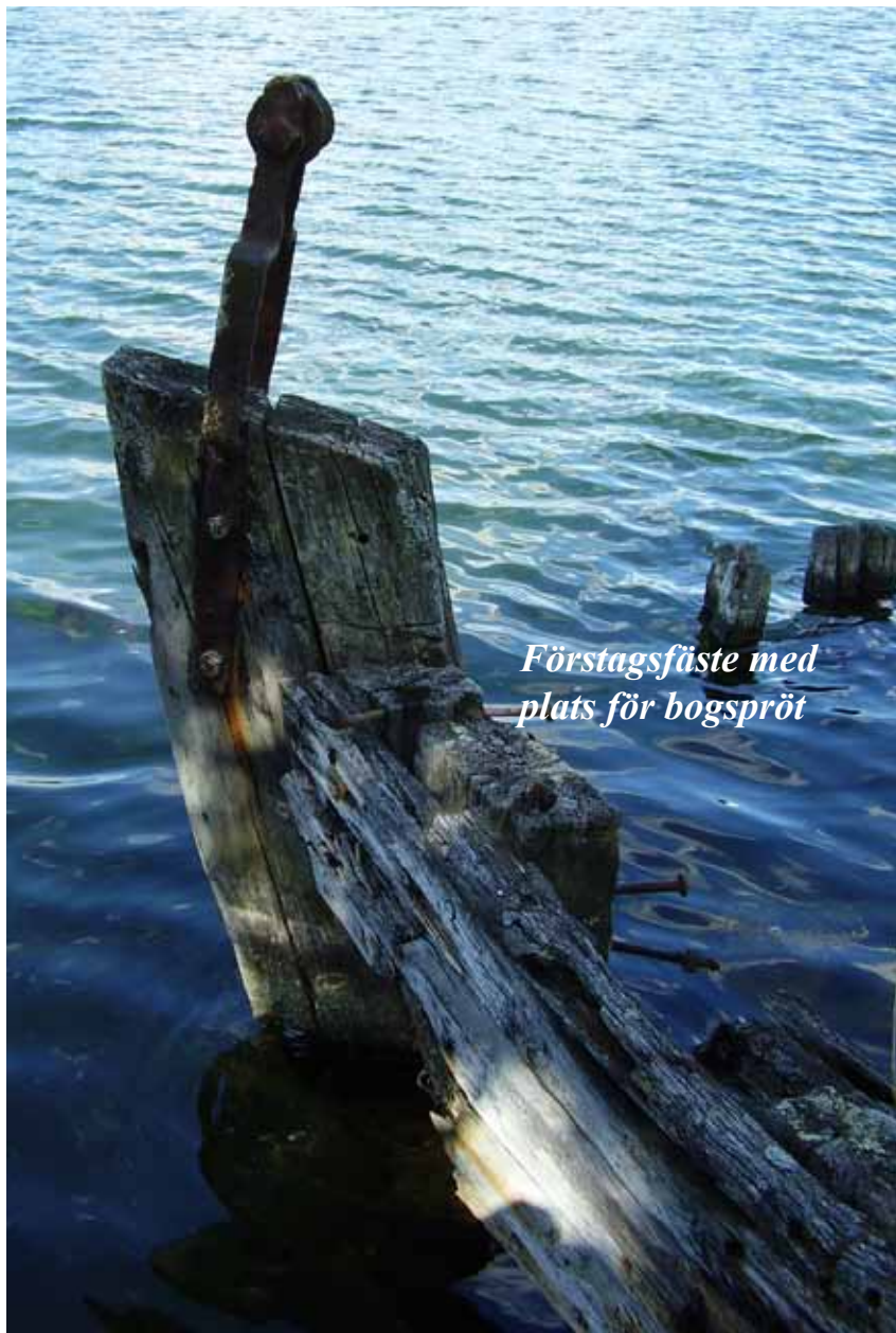
Förstagsfäste med plats för bogspröt