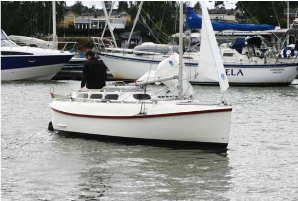
Sjösättning och segeltrim i den råkalla Bråviken.