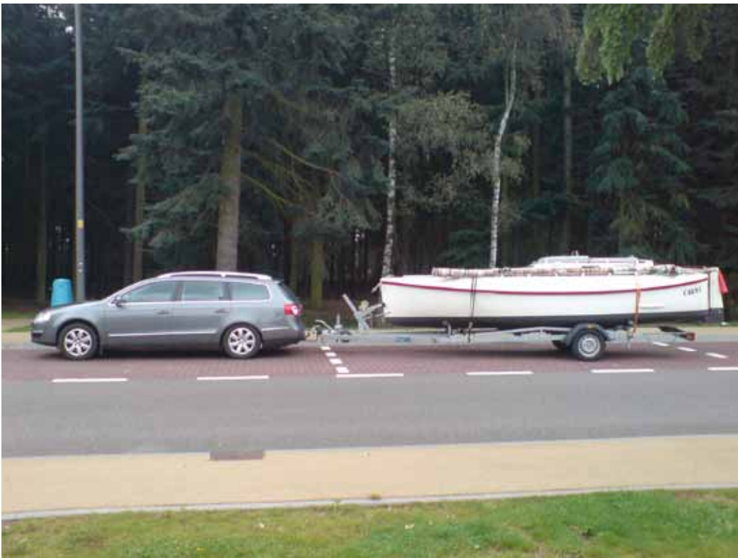
Snart bär det i väg. Söderut ????