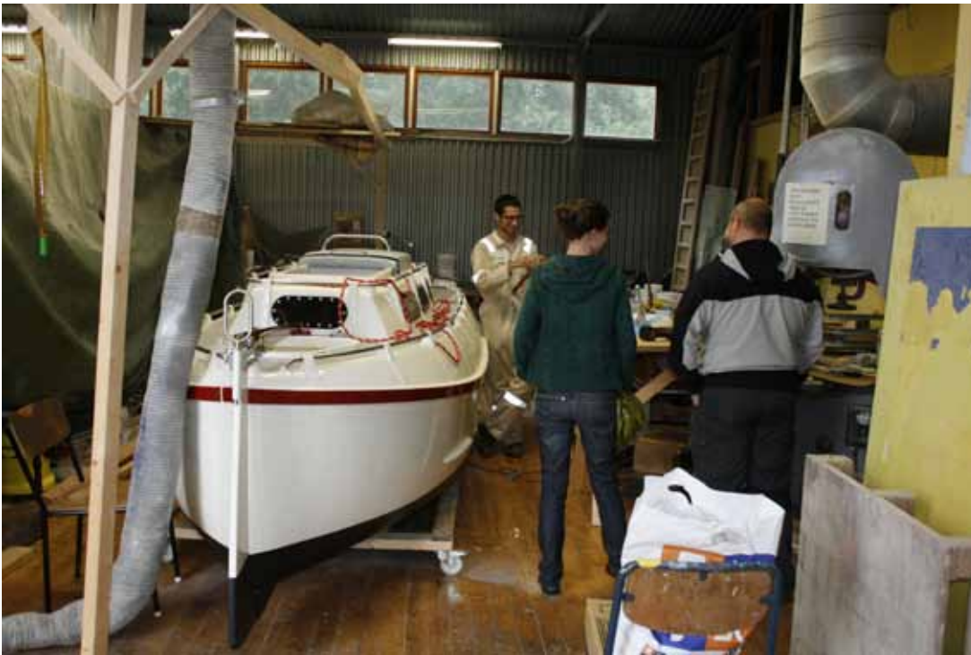
Carma fortfarande på varvsgolvet. Besökare anländer för att se på resultatet