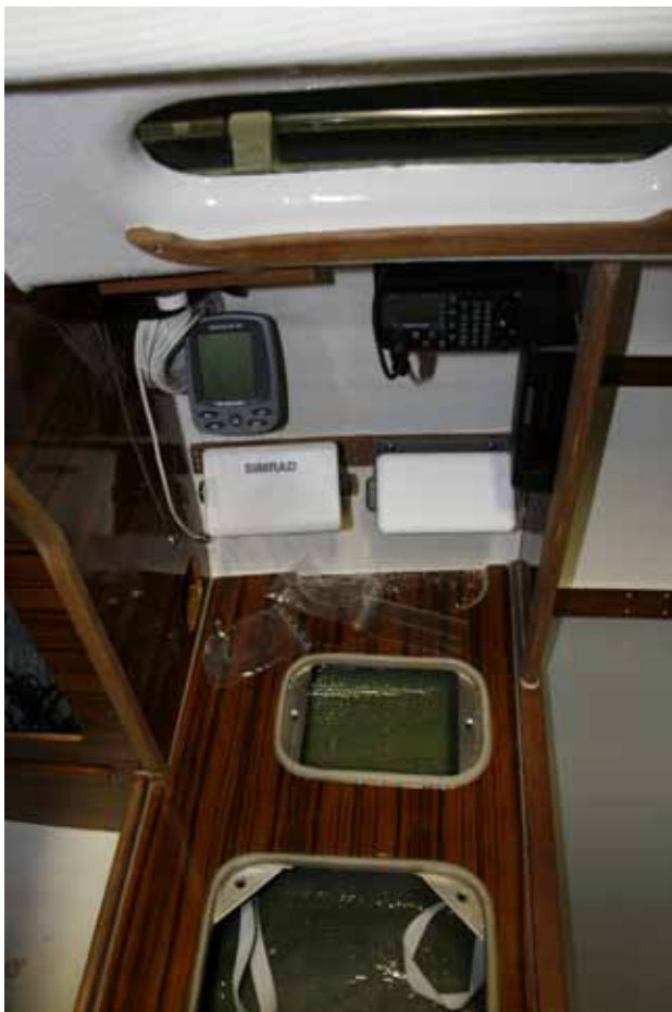
Det är inget fel på finnishen heller